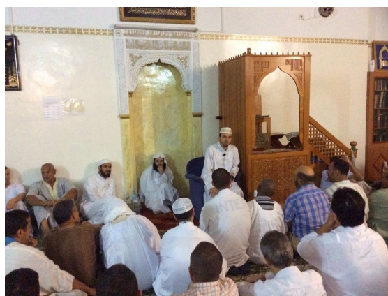
En la mezquita de Estepona en Málaga